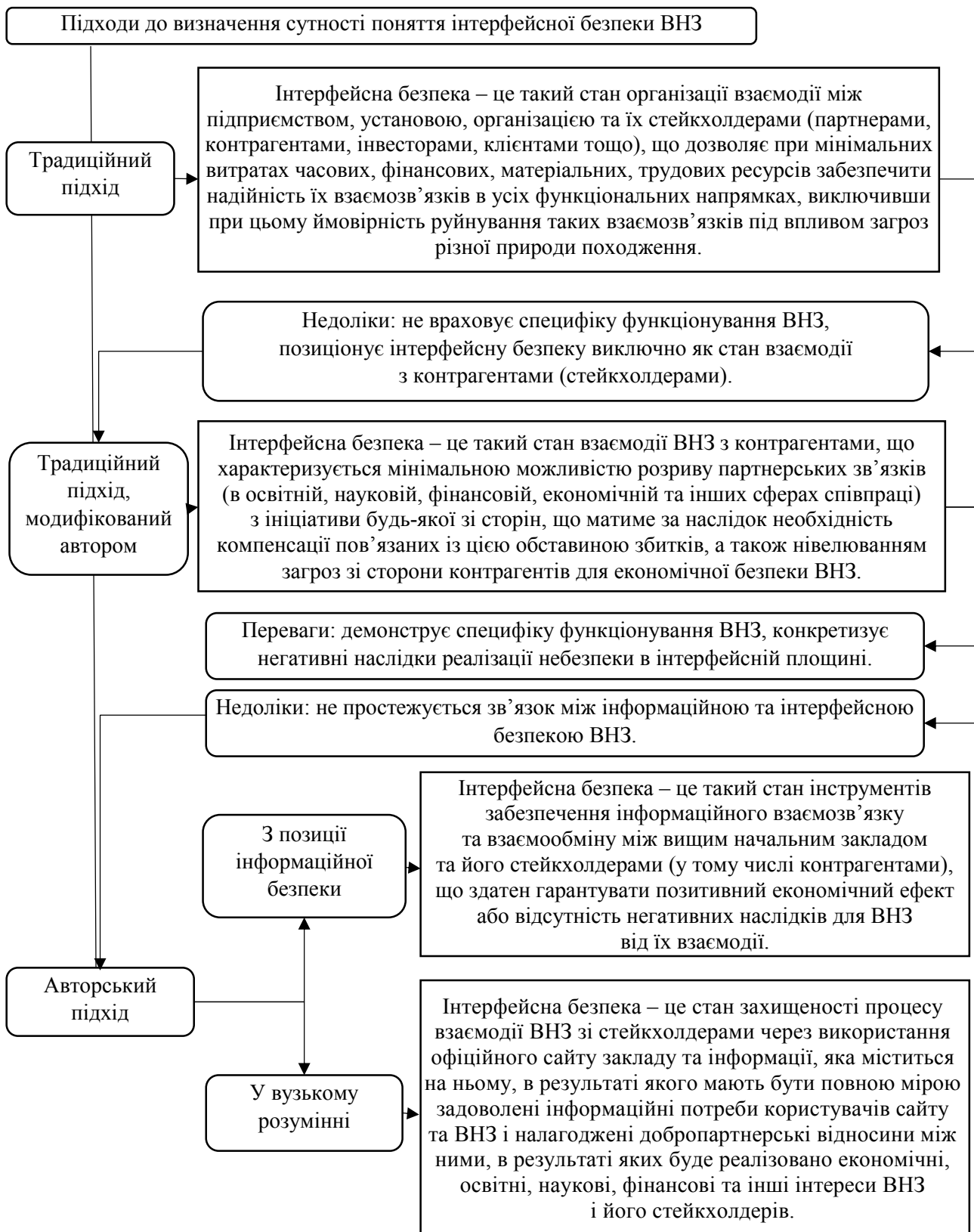
Рис. 2. Підходи до визначення поняття інтерфейсної безпеки як складової економічної безпеки ВНЗ (Складено автором)

та інтерфейсної безпеки вищих навчальних закладів. Тому його розробка є важливим науковим завданням для фахівців з економічної безпеки.