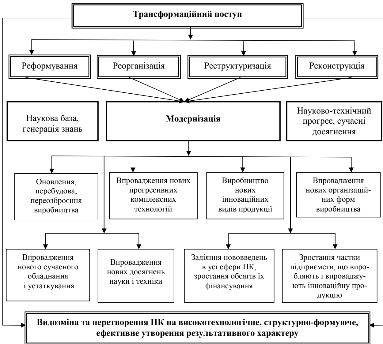
Рис. 1. Трансформаційно-модернізаційний розвиток ПК з вектором на економічне зростання

відносин. Модернізаційні процеси, які охоплюють усі сторони суспільного життя, є рушієм соціально-економічного розвитку, фактором його стабільності. Тому необхідним є формування і побудова ефективного модернізаційного механізму економіки у відповідності з новими завданнями і умовами розвитку в найближчі роки.