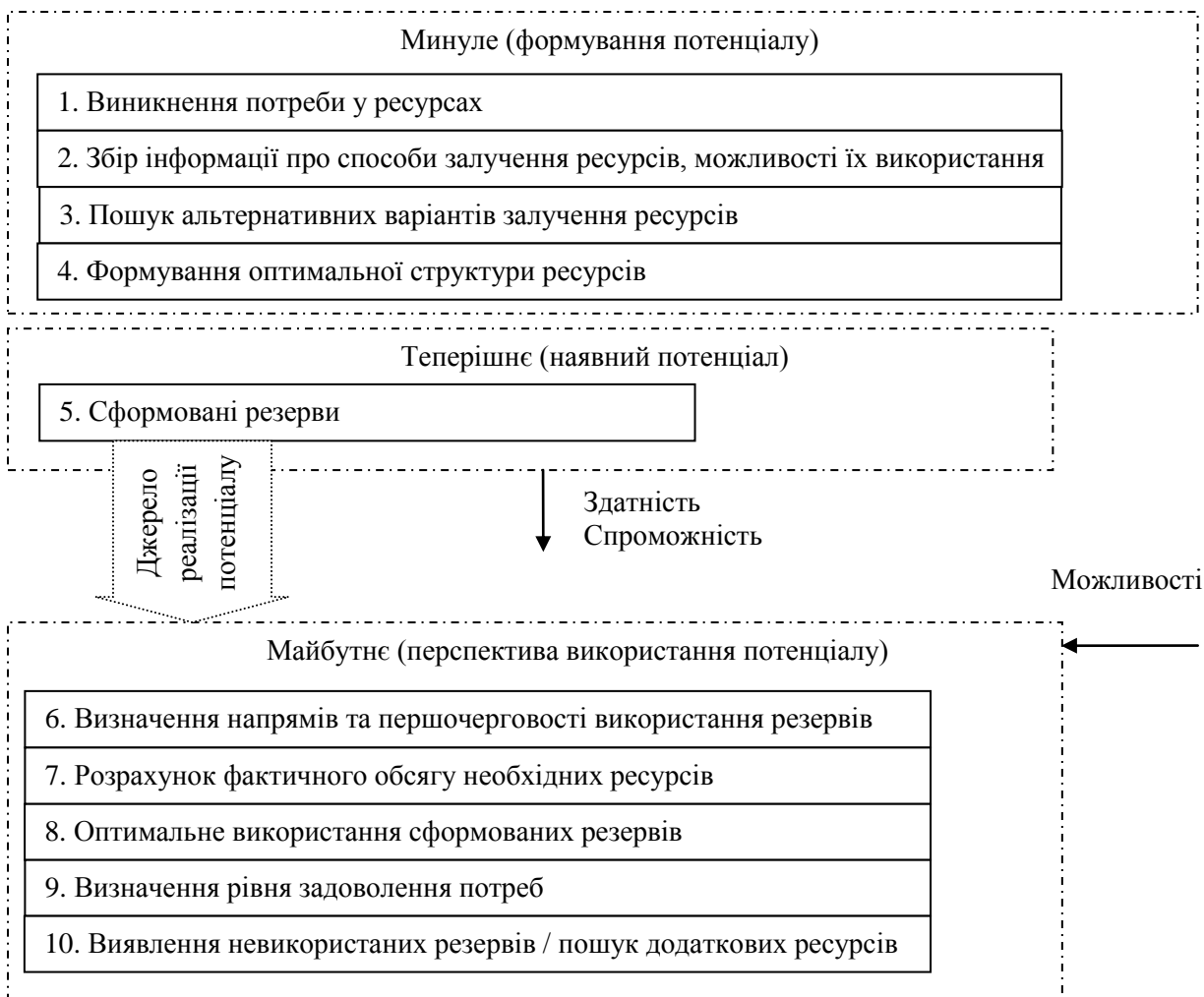
Рис. 1. Декомпозиційна діаграма процесу формування та реалізації потенціалу

лу, ефективність якого визначається максимально отриманим обсягом матеріальних благ при мінімальному використанні сформованих резервів. Важливим є своєчасне виявлення нестачі ресурсів та оперативне задоволення цієї потреби.