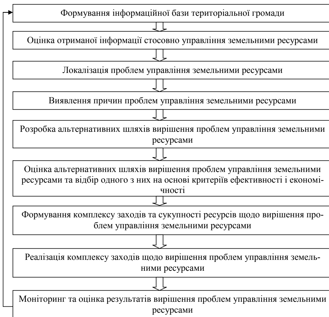
Рис. 2. Алгоритм вирішення проблем управління земельними ресурсами територіальних громад в Україні