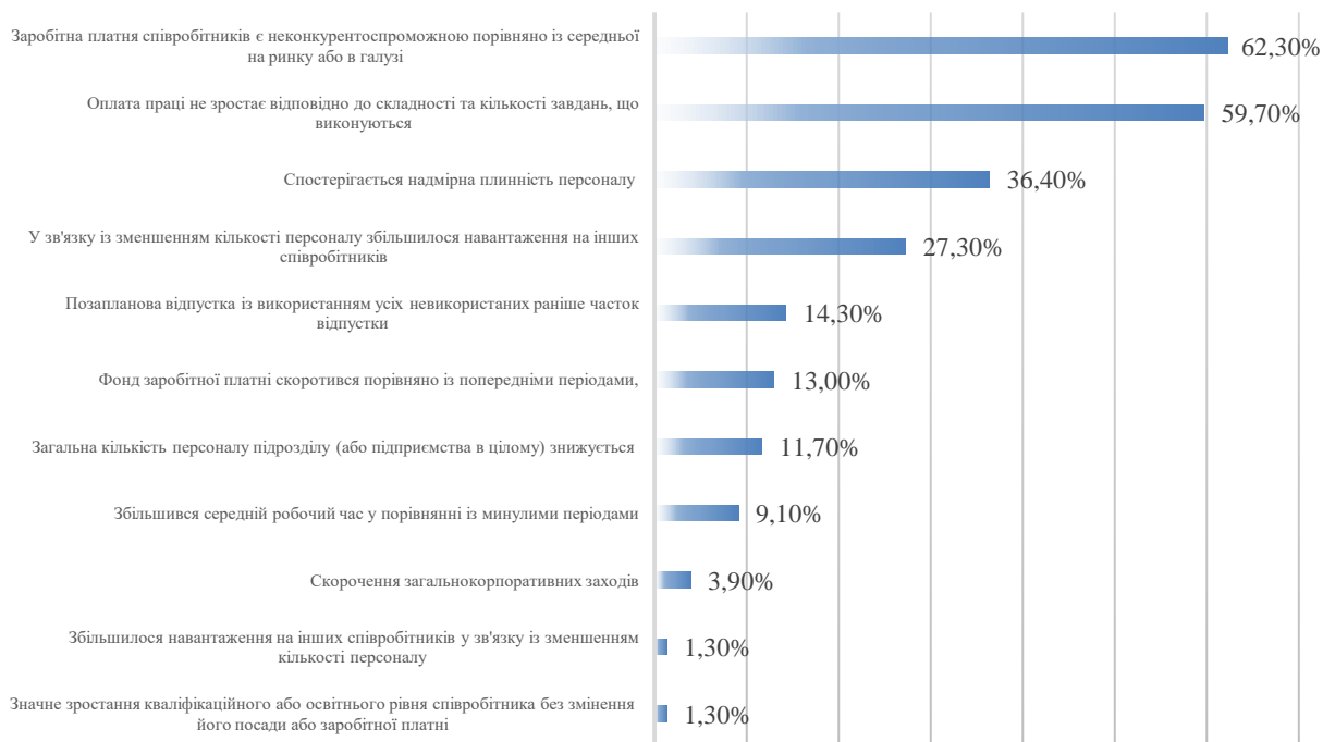
Рисунок 3 – Предиктори звільнень співробітників (результати власного дослідження)

Отже, до найбільш інформативних предикторів імовірного звільнення персоналу належать: