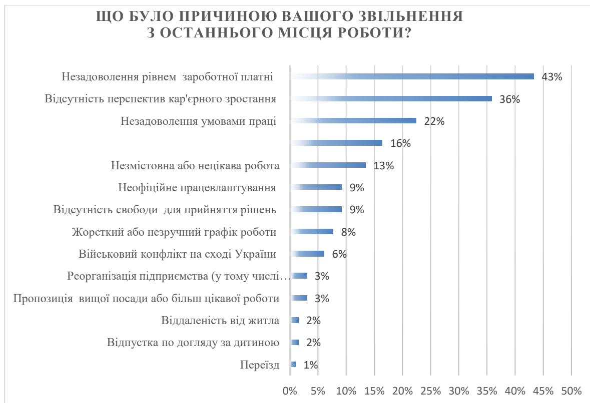
Рисунок 2 – Причини звільнення з останнього місця роботи (уточнено автором)

За результатами проведеного опитування виявлено причини звільнень персоналу підприємств, які зображено на рисунку 2.