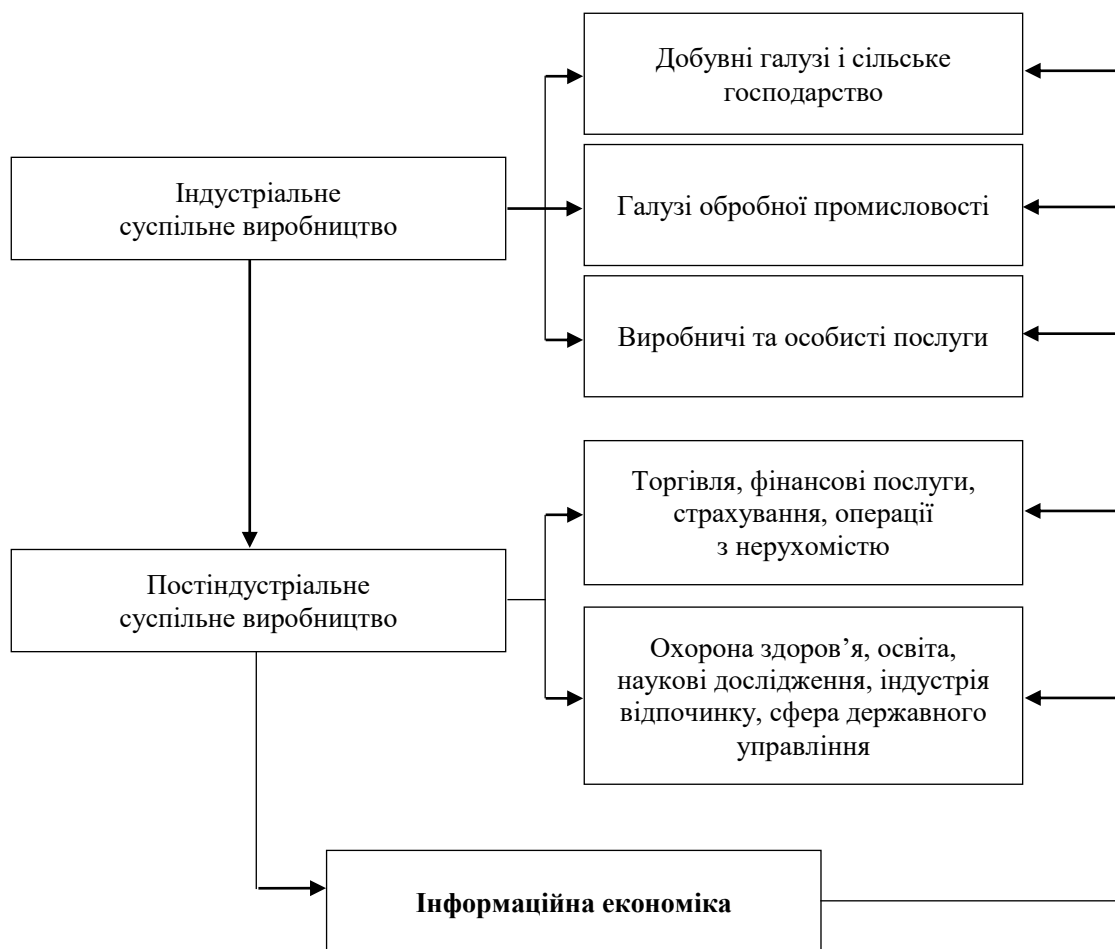
Рисунок 1. Трансформація структури суспільного виробництва

Таким чином, дослідження процесів суспільного виробництва дало змогу сформувати етапи трансформації його структури (рисунок 1).