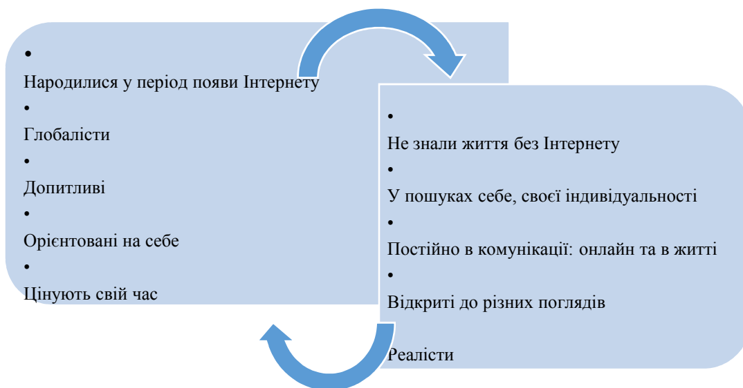
Рисунок 1. Ключові характеристики зумерів (зліва) та міленіалів (справа)

Хоча цифровізація швидко змінює бізнес-середовище, керівникам важливо контролювати ситуацію. Стратегічне планування сьогодні значно ускладнюється небаченою швидкістю змін, складністю прогнозування цих змін на середню та довгу перспективу. Водночас нинішні реалії продемонстрували, що потужним драйвером відновлення маркетингу під час війни стало покоління зумерів, тобто тих, хто народився у період з 1997 по 2012 роки; важливим для них є стирання меж між онлайн та офлайн діяльністю, насамперед у стратегіях брендів, лояльність до яких демонструють самі зумери та міленіали, попри навіть деякі відмінності між поколіннями (рис. 1).