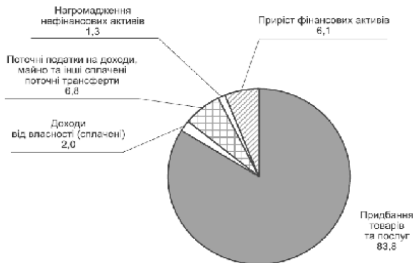
Рис. 2. Структура витрат і заощаджень населення в 2011 році [9]

Найбільшу питому вагу в структурі доходів населення 2011 року займають заробітна плата – 42,2 % та соціальні допомоги з іншими трансфертами – 37,4 % (табл. 2). Відсоток прибутку та змішаний дохід становлять 15,1 %, незначною є питома вага доходів від власності – 5,3 %. Висока питома вага витрат населення на товари та послуги а також незначний приріст фінансових активів свідчать про низькі фінансові можливості населення та про те, що основна частина громадян України витрачає більшість отриманих коштів на щоденні нагальні потреби (рис. 2).