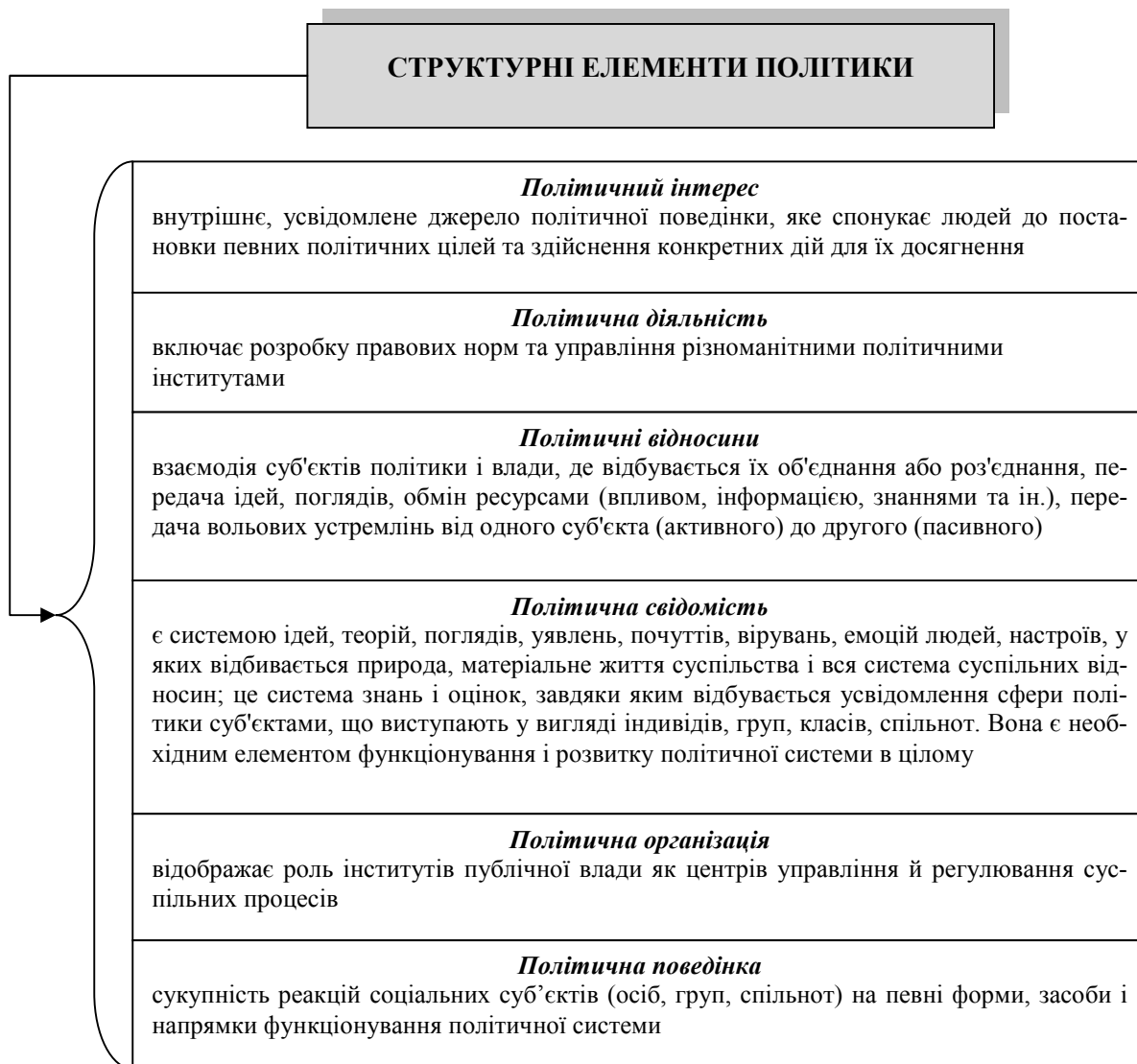
Рис. 1. Структурні елементи політики

Структуру політики відображено на рис. 1.