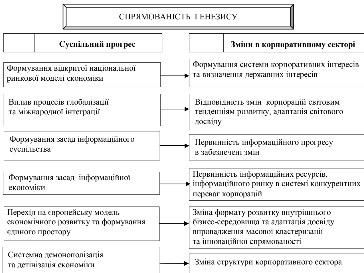
Рис. 1. Генезис формування новітньої моделі корпоративного сектору та об'єктивності потреби в змінах механізмів державного регулювання корпоративного сектору в Україні

Старий технологічний уклад характеризувався пріоритетними галузями: важкого і точного машинобудування, хімічної та нафтохімічної промисловості, енергетики, металургії та ін. Ці галузі ресурсномісткі. Вони унікальні за масштабами споживання енергетичних ресурсів. У більшості випадків вони також вкрай трудомісткі. В результаті лідерами такого прогресує країни з великим виробництвом, масштабним монопольним і олігопольним секторами, тут переважають масштабні транспортні мережі, лідирують авіа- та автотранспорт, сформовані великі міжнаціональні банківські системи. Класичними прикладами таких країн-лідерів даного технологічного укладу в сучасному світі є Німеччина, Австрія, Франція, Японія, Фінляндія та ін.