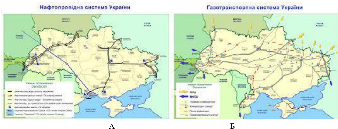
Рисунок 2 (А, Б) – Нафтотранспортна та газотранспортна системи України, 2022 р.

Розглянемо завдання вибору способу транспортування нафти (газу) територією України. Для цього прийємо умовні вихідні дані такими: відстань – 1000 км, об'єм – 100 т, нафто-(газо-) сховище знаходиться на відстані 30 км від транспортного підприємства. Тарифи з урахуванням повного завантаження транспортного засобу залежно від виду транспортного засобу наведено у таблиці 4.