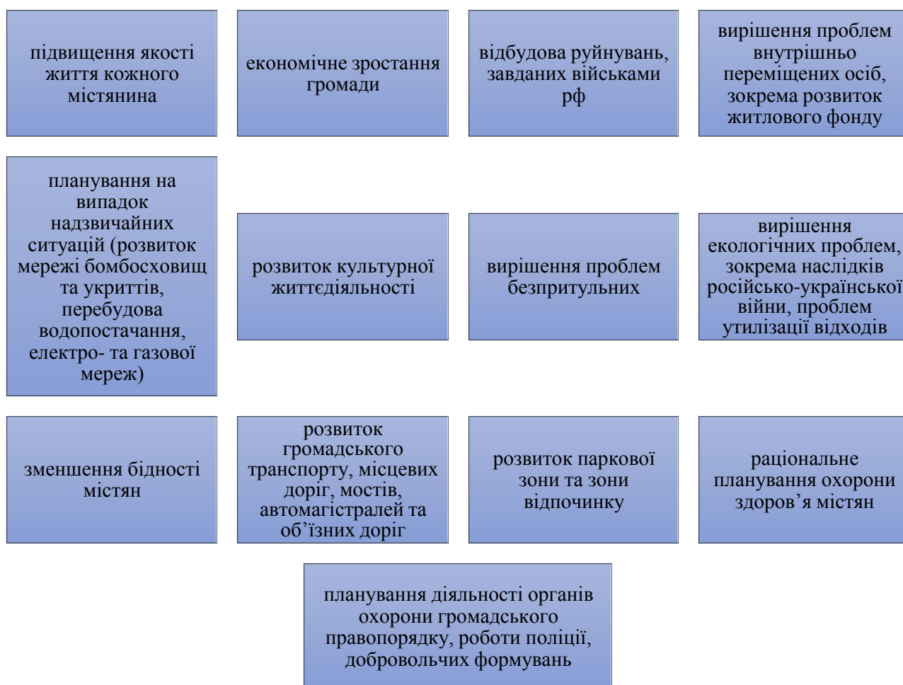
Рисунок 2. Напрями проведення політики міської безпеки

У післявоєнний період Україна переживатиме значну трансформацію в усіх сферах. Тому при розроблянні соціально-економічної моделі безпеки міст України та провадженні політики міської безпеки слід брати до уваги такі напрями (рисунок 2).