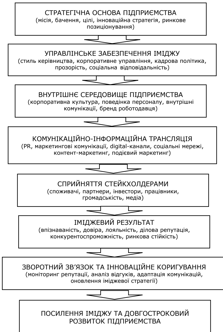
Рисунок 1. Формування іміджу підприємства в умовах інноваційної моделі економіки

Поряд із цим цифрові технології змінюють не тільки канали донесення іміджу, а й сам механізм управління ним. Використання аналітики даних, платформ дистанційної комунікації, CRM-інструментів та елементів штучного інтелекту дає підприємству змогу точніше сегментувати аудиторії, персоналізувати звернення, відстежувати зворотний зв'язок і швидше коригувати комунікаційну політику. У сучасних дослідженнях це описується як частина загальної цифрової трансформації управління підприємствами та розвитку комунікацій (Пригодюк, 2025).