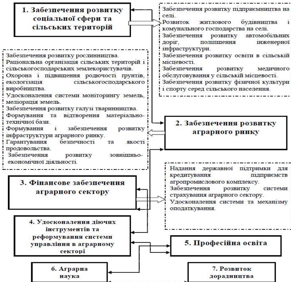
Рис. 3. Структура напрямів і завдань «Державної цільової програми розвитку українського села на період до 2015 року»*

вищення престижності сільського здорового образу життя, привабливості сільськогосподарської праці чи інших несільськогосподарських видів діяльності тощо.