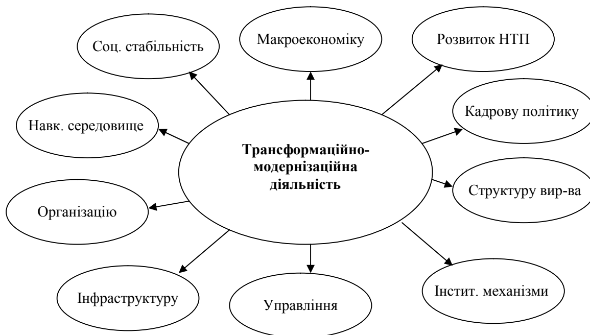
Рис. 2. Напрями впливу модернізації на діяльність та процеси суспільного розвитку

Водночас, структурно-технологічні зрушення, що відбулися в роки незалежності, значною мірою мали стихійний характер, а основні механізми зростання продовжують концентруватися в групі галузей, які базуються на використанні екстенсивних факторів виробництва. Такі галузі в своєму розвитку обмежуються відносно невисоким рівнем інноваційно-модернізаційної активності, що не сприяє підвищенню конкурентоспроможності економіки. В цілому, модернізаційна діяльність має спадну тенденцію розвитку. Впродовж 2015 р. кількість організацій, що здійснювали наукову і науково-технічну діяльність, становила 978 одиниць, що менше чим в попередні роки (2014 р. – 999, 2010 р. – 1303 од.).