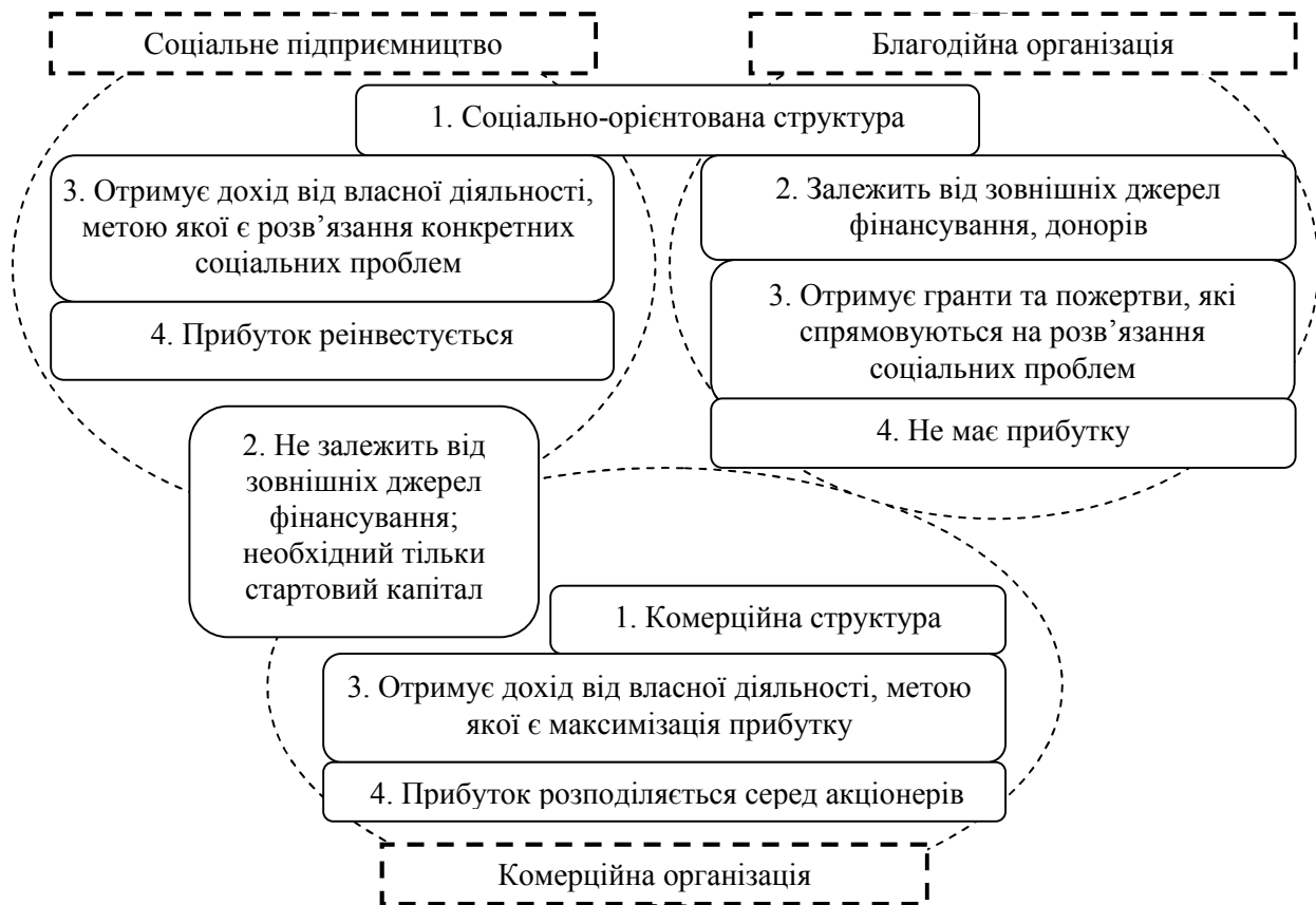
Рис. 1. Ключові відмінності соціального підприємства від комерційних та благодійних організацій*

відповідальними є підприємства, основною для яких є комерційна діяльність, а соціальні проекти реалізуються ними в рамках спонсорської допомоги. Соціально орієнтовані підприємства інтегрують бізнес з соціальною активністю, спрямовуючи свою діяльність на досягнення певних соціальних цілей (наприклад, працевлаштування людей з обмеженими можливостями, зокрема з метою мінімізації оподаткування; вирішення соціальних проблем місцевих громад завдяки створенню нових робочих місць, підвищення ефективності використання стратегічних ресурсів тощо). Соціальні підприємства є найбільш соціально активними, досягнення соціального ефекту для яких виступає основною метою, а одержання прибутку є засобом для її досягнення [2, с. 160].