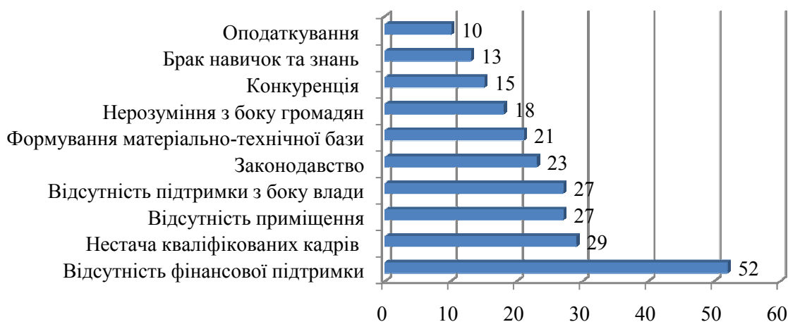
Рис. 4. Чинники, які стримують розвиток соціальних підприємств в Україні*

*Джерело: використано автором за даними [9, с. 24]