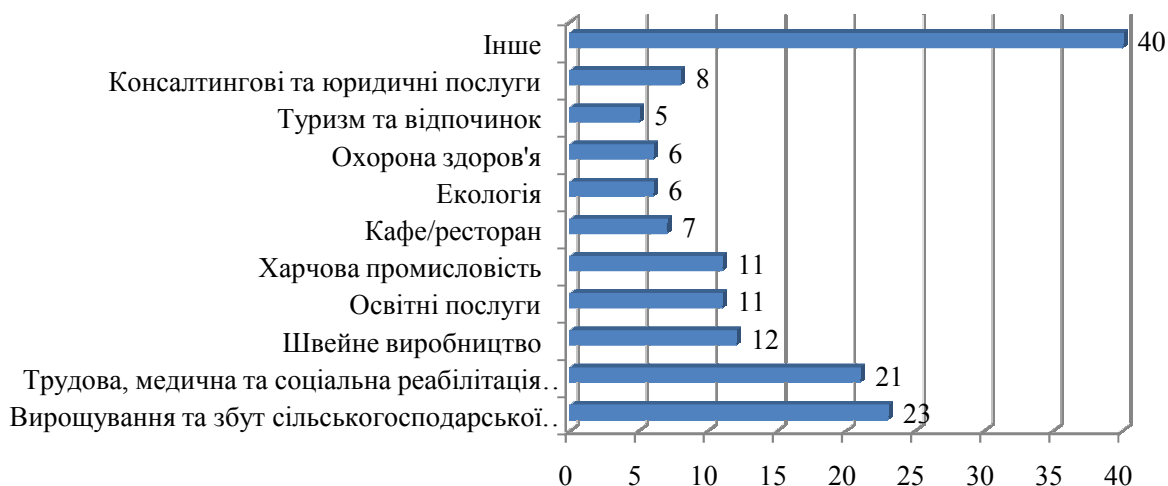
Рис. 3. Зміст діяльності соціальних підприємств*

Серед опитаних соціальних підприємств, найбільша кількість займається вирощуванням та збутом сільськогосподарської продукції (23 організації), а саме: ягоди, гриби, молочна продукція тощо. На другому місці за кількістю діючих знаходяться соціальні підприємства, які здійснюють трудову, медичну та соціальну реабілітацію інвалідів (21 організація). Як правило, до них належать підприємства об'єднання громадян, зокрема: Українське товариство сліпих, Українське товариство глухих, Всеукраїнська організація інвалідів тощо. Окрім основної діяльності з реабілітації людей з інвалідністю, дані підприємства здійснюють виготовлення різноманітної продукції (наприклад, торгівельне обладнання, електротехнічні вироби, бітумні та паливні емульсії, сумішеві мазути з вторинної сировини, нафтовідходи тощо). До інших видів діяльності належать: організація благодійних крамниць; працевлаштування та реабілітація осіб, котрі перебувають у складних життєвих обставинах; вироби хенд-мейд; коворкінг; надання типографічних послуг тощо [9, с. 11].