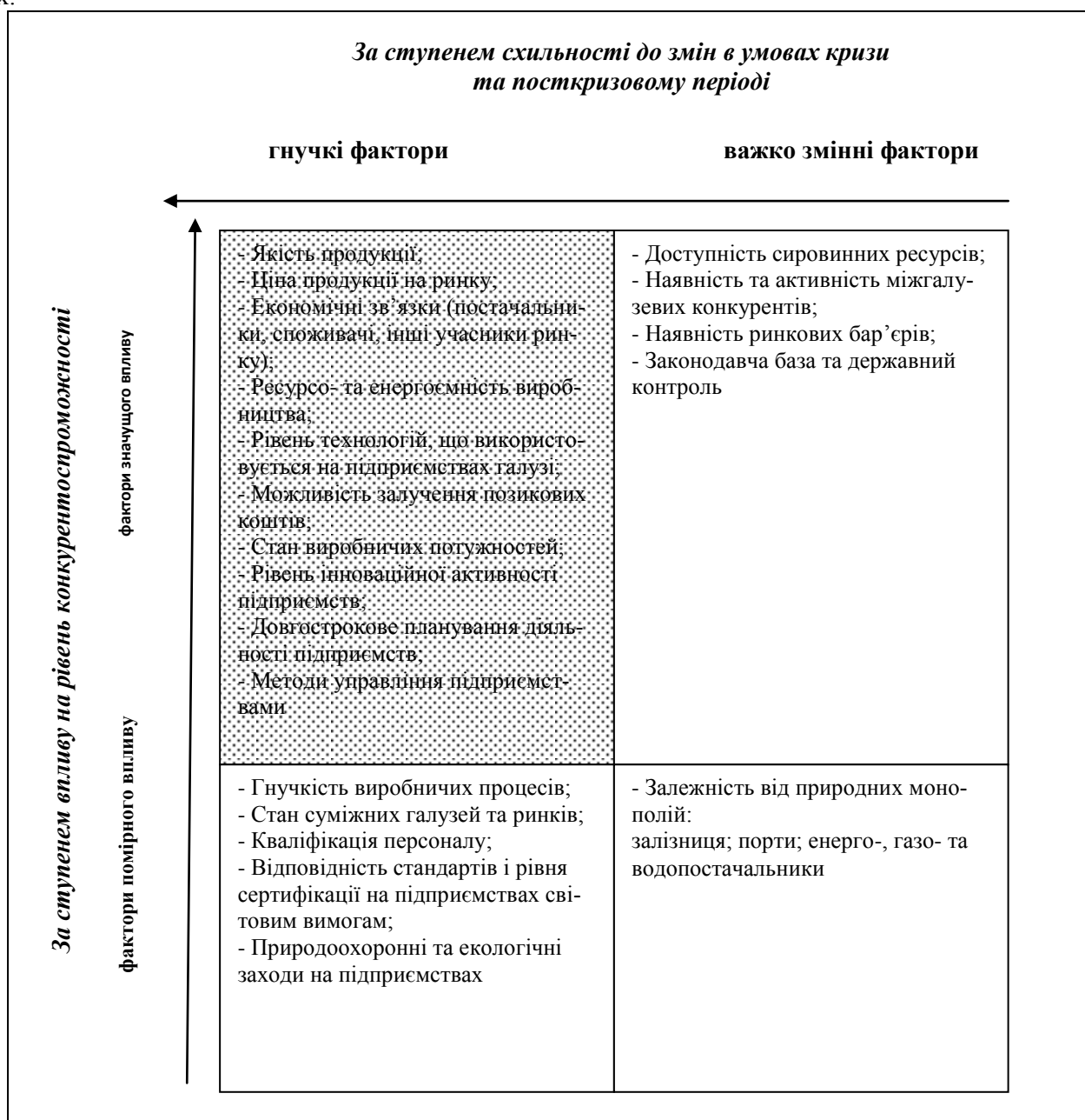
Рис. 3. Класифікація факторів конкурентоспроможності промисловості в умовах кризи та у посткризовий період

мки пріоритетних напрямів економічного розвитку на національному, регіональному і галузевому рівнях.