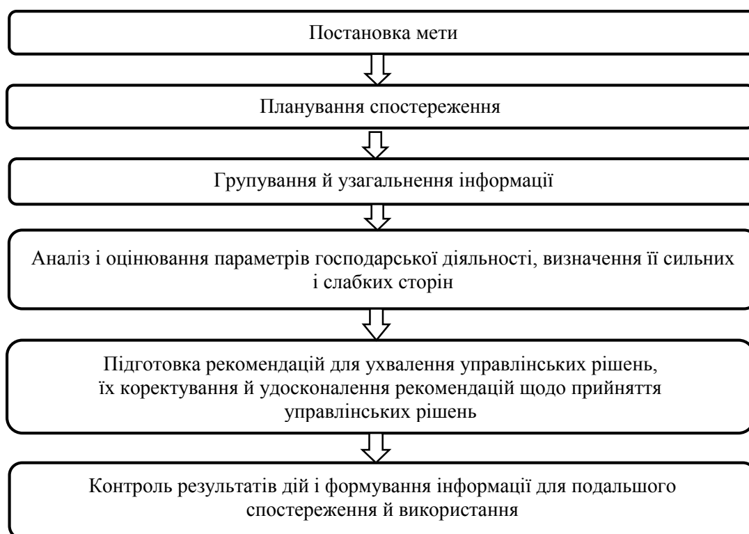
Рис. 2. Етапи процесу фінансового моніторингу підприємств харчової промисловості

Погоджуємося з думкою Басюк Т. П. [1], що процес фінансового моніторингу включає такі етапи: постановка мети; планування спостереження; збирання, групування й узагальнення інформації; аналіз і оцінювання параметрів господарської діяльності, визначення її сильних та слабких сторін; підготовка рекомендацій для ухвалення управлінських рішень, їх коректування й удосконалення рекомендацій щодо прийняття управлінських рішень; контроль результатів дій і формування інформації для подальшого спостереження й використання. Відповідно визначаємо етапи процесу фінансового моніторингу підприємств харчової промисловості (рис. 2).