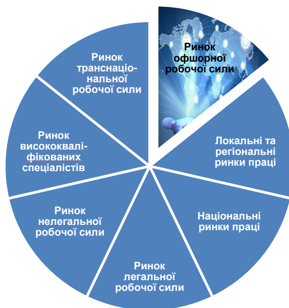
Рис. 1. Структура глобального ринку праці

Другий доволі великий сегмент глобального ринку праці – робоча сила, яка походить з районів світу з відносно низьким рівнем економічного розвитку. Серед цих працівників треба вирізнити специфічний шар так званої нелегальної робочої сили, чималі потоки якої спрямовуються в індустріальні країни. Серед цих працівників треба вирізнити специфічний загін так званої нелегальної робочої сили, чималі потоки якої спрямовуються в індустріальні країни, зокрема США. Економічна функція нелегального ринку праці зводиться переважно до обслуговування потреб величезної маси дрібних та середніх підприємств в індустріально розвинених країнах, які, на відміну від великих підприємств, неспроможні застосовувати в широких масштабах дорогі працезбережувальні технології. Ці підприємства не можуть також за потреби переводити свої капітали у країни з дешевою робочою силою, як це часто роблять великі ТНК. Структуру глобального ринку праці подано на рис. 1.