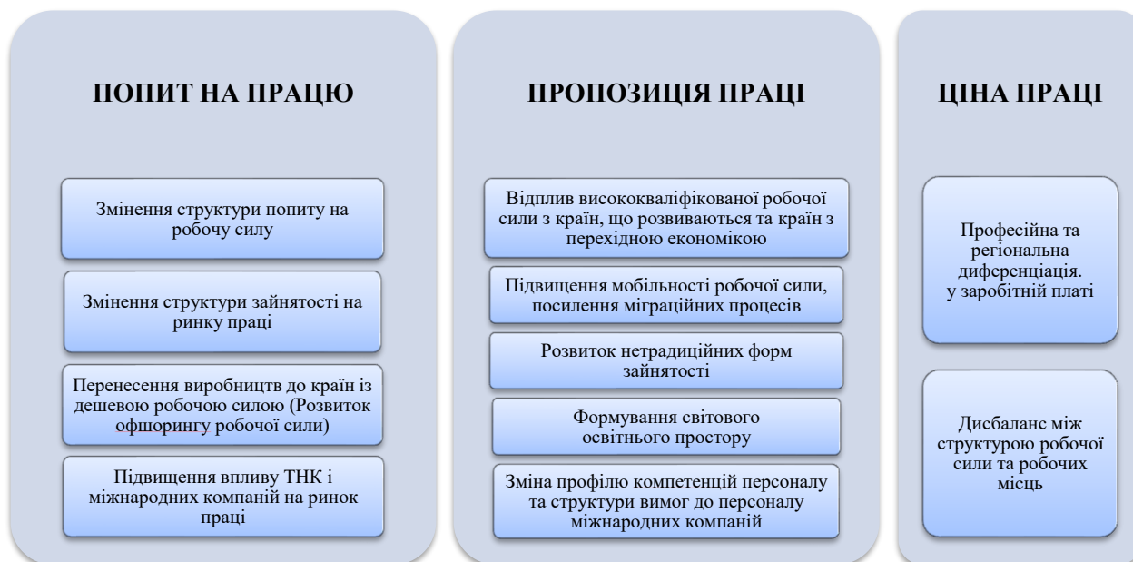
Рис. 3. Структурні трансформації глобального ринку праці Узагальнено авторами

Зміна структури зайнятості. Внаслідок синергічного ефекту глобалізації та технологічної революції в соціально-економічній сфері різних країн відбуваються фундаментальні зрушення в структурі світової економіки, проявом чого стає зниження частки виробничого сектора і зростання сектора послуг, деконцентрація промислового виробництва, зрушення в його галузевій структурі тощо. Зазначені зрушення приводять до змін у структурі й характері зайнятості, значно впливають на стан ринку праці, формують нові тенденції його розвитку [5]. У розвинутих країнах продовжується зменшення частки обробної промисловості з одночасним розвитком сервісної економіки і збільшенням її питомої ваги.