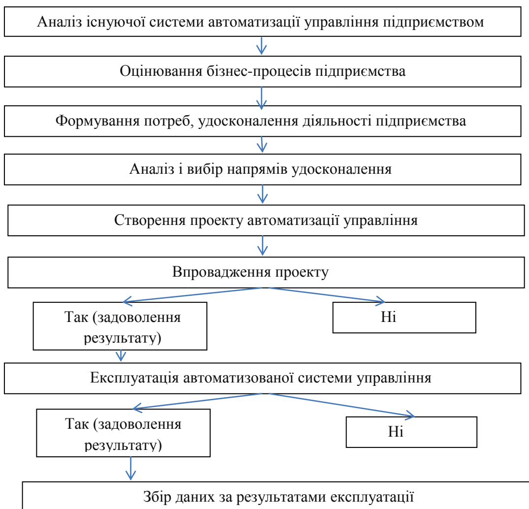
Рисунок 2 – Алгоритм використання інформаційних технологій у господарській діяльності підприємства

Початковим етапом механізму є визначення мети підприємства із зазначенням мети впровадження інформаційних технологій. Наступним є врахування принципів створення та впровадження інформаційних технологій, до яких належать принципи економічності, сумісності, системності, варіативності, контролю, захисту.