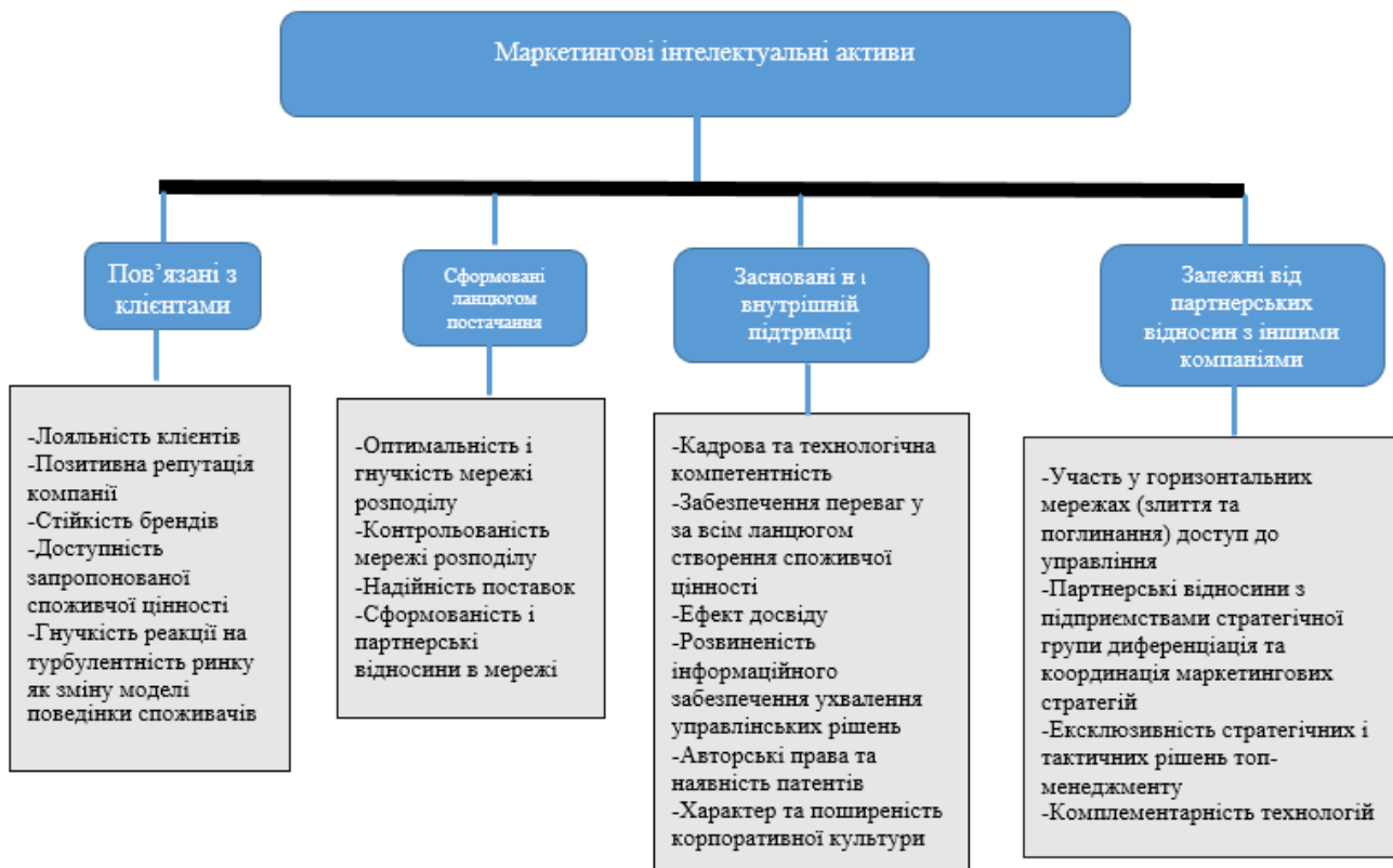
Рисунок 3 – Структура внутрішніх та зовнішніх маркетингових інтелектуальних активів підприємства [12]

Процеси брендингу та ефективність створення бренду спираються на весь спектр наявних маркетингових активів підприємства. За умов ефективності процесу його формування бренд стає цінним маркетинговим активом, який може створювати стійкі та довгострокові конкурентні переваги підприємства. Структуру маркетингових активів підприємства зображено на рис. 3.