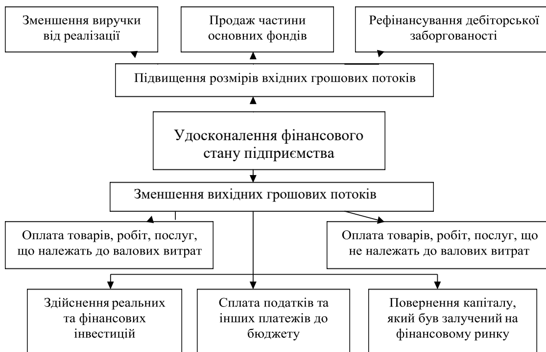
Рисунок 1 – Шляхи удосконалення фінансового стану підприємства