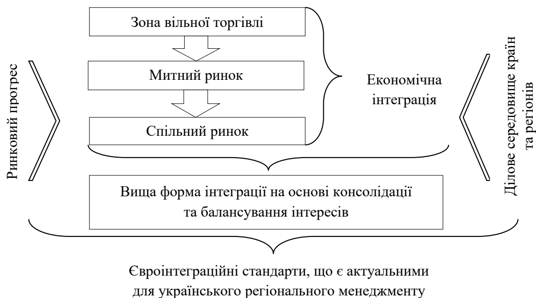
Рисунок 2 – Етапи інтеграційних процесів, що відбуваються в економіці українських регіонів та відповідають євроінтеграційним стандартам

Розвиток інтеграційних процесів можна відобразити як послідовність етапів, які відбуваються один за одним (рисунком 2).