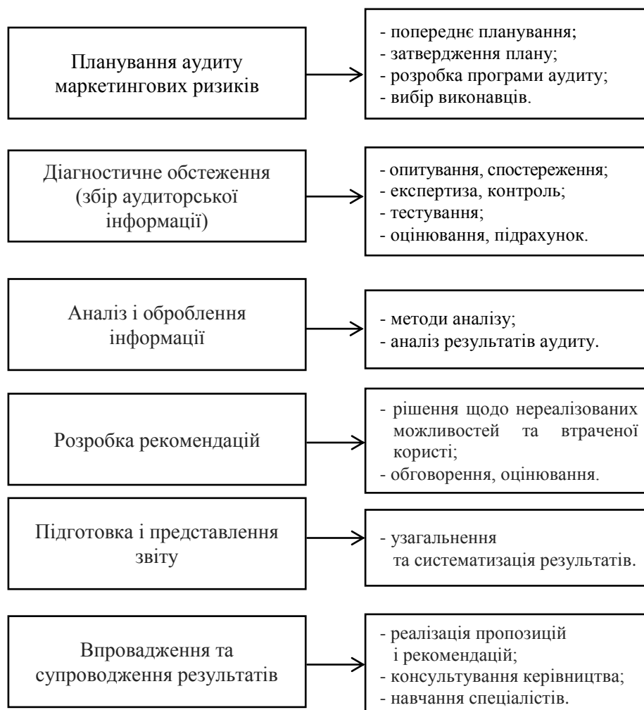
Рисунок 2 – Етапи процесу аудиту маркетингових ризиків