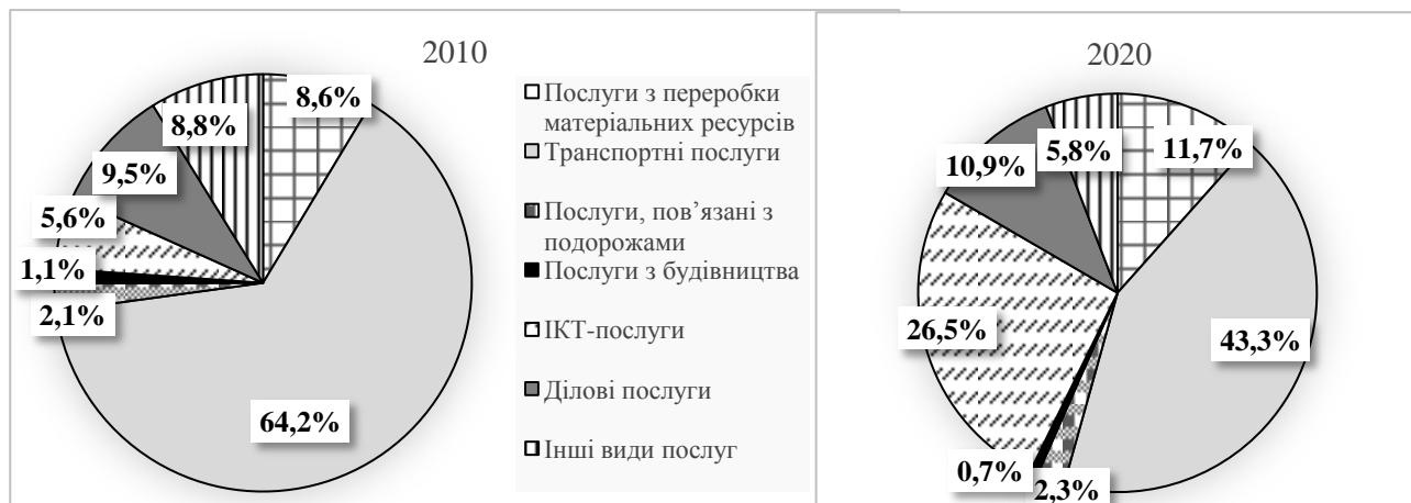
Рисунок 3 – Розподіл експорту послуг з України за видами у 2010 та 2020 рр.

Розглянемо детальніше структуру експорту українських послуг (рисунок 3).