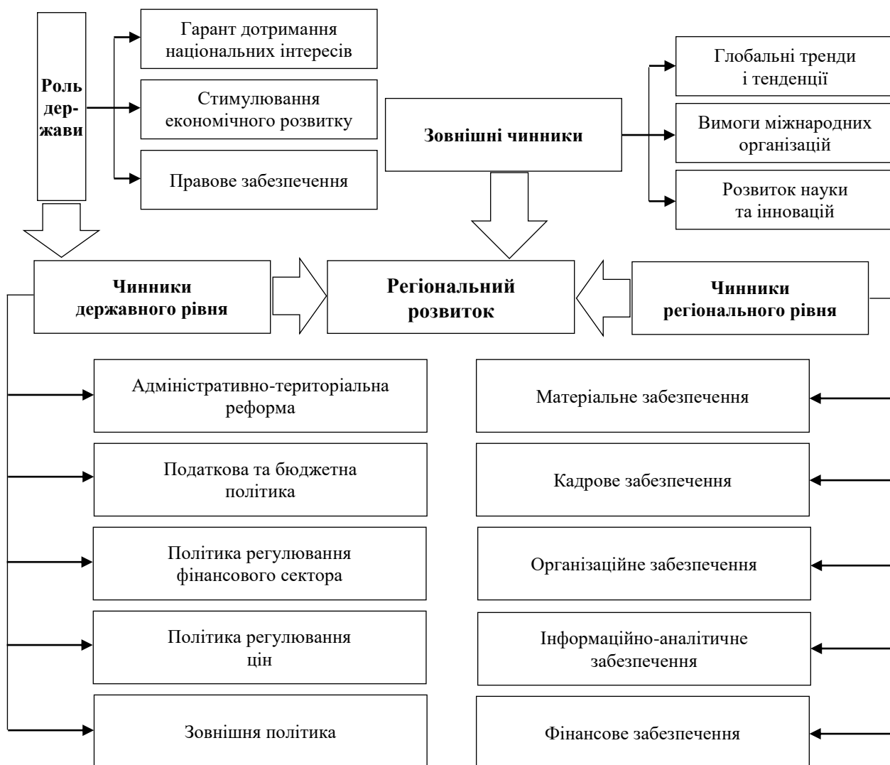
Рисунок 1. Чинники впливу на регіональний розвиток

розв'язання проблемних питань логістики та транспортної інфраструктури; розв'язання проблемних питань енергопостачання [10].