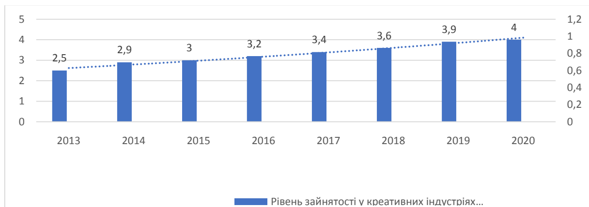
Рисунок 3. Рівень зайнятості у креативних індустріях України протягом 2013–2020 рр. Складено за [4]

Отже, на основі проведеного дослідження можна зазначити, що протягом останніх років простежувалася тенденція до поступового зростання ролі креативних індустрій в економіці країни, що можна підтвердити такими позитивними трендами: приріст доданої вартості креативних індустрій – 13 %; приріст кількості суб'єктів господарювання в креативних індустріях України – 12 %; приріст обсягів реалізованої продукції креативними індустріями України – 17 %; приріст зайнятості в креативних індустріях України – 0,1 %.