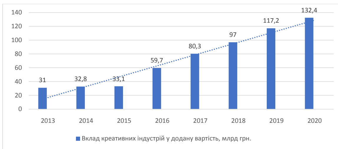
Рисунок 1. Внесок креативних індустрій до загальної величини доданої вартості в Україні за 2013–2020 рр.