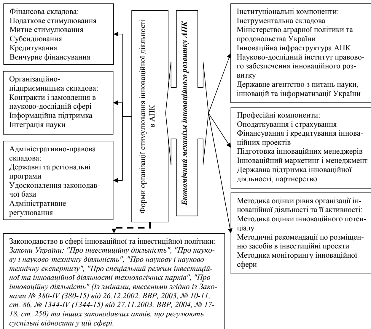
Рис. 2. Показовий економічний механізм інноваційного розвитку регіонального АПК*