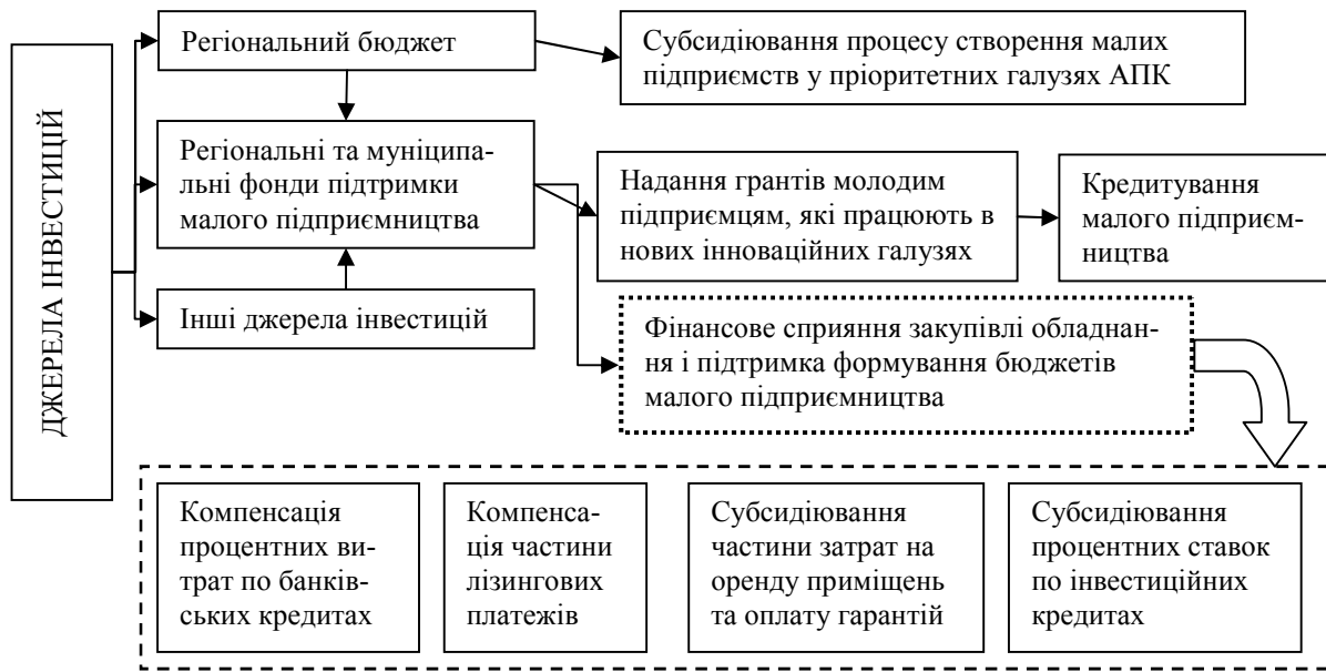
Рис. 4. Фінансово-кредитна підтримка розвитку малого бізнесу в регіоні