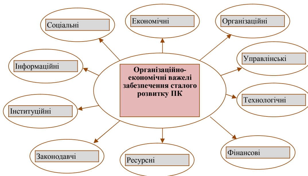
Рис. 1. Основні важелі організаційно-економічного розвитку продовольчого комплексу країни

Реалізація закономірностей потребує розробки певних правил їх застосування, так званих принципів, що являють собою стисло викладені науково обґрунтовані положення, керівні ідеї, правила господарювання, цілеспрямовану дію, якою мають керуватися суб'єкти економічної діяльності в своєму розвитку. Обґрунтування системи принципів в певній сфері діяльності залежить від поставлених задач, її специфіки та особливостей, загального курсу соціально-економічної політики. Розвиток ПК, формування його організаційно-економічного механізму сталого функціонування має враховувати і базуватись як на принципах загальноекономічного, так і специфічного характеру. Серед принципів загальноекономічного характеру варто вказати наступні: принципи науковості, комплексності, системності, збалансованості, пропорційності, ефективності, сталості, адаптивності, оптимальності, соціальної орієнтації; а серед принципів специфічного характеру – функціональної інтеграції, продовольчої безпеки, ресурсозбереження, мобільності, доцільності, плановірності, відкритості, задоволення попиту, ритмічності, неперервності.