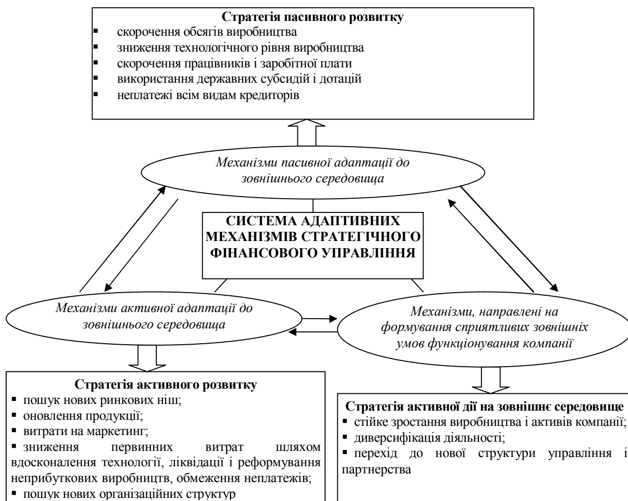
Рис. 1. Система адаптивних механізмів стратегічного фінансового управління

3. Механізми, направлені на формування сприятливих зовнішніх умов функціонування компанії та реалізацію стратегії активної дії на зовнішнє середовище.