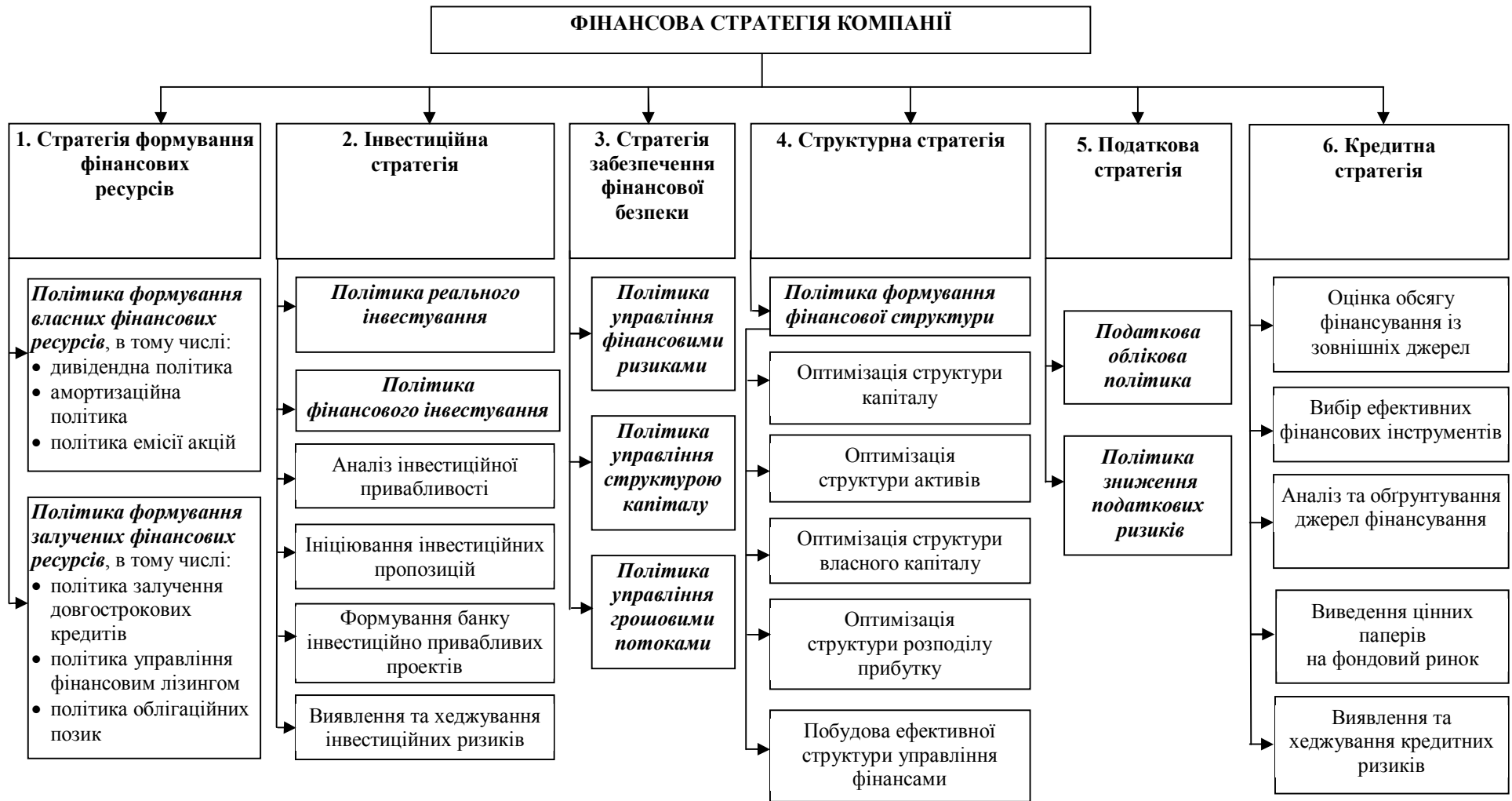
Рис. 2. Структура фінансової стратегії сталого розвитку компанії