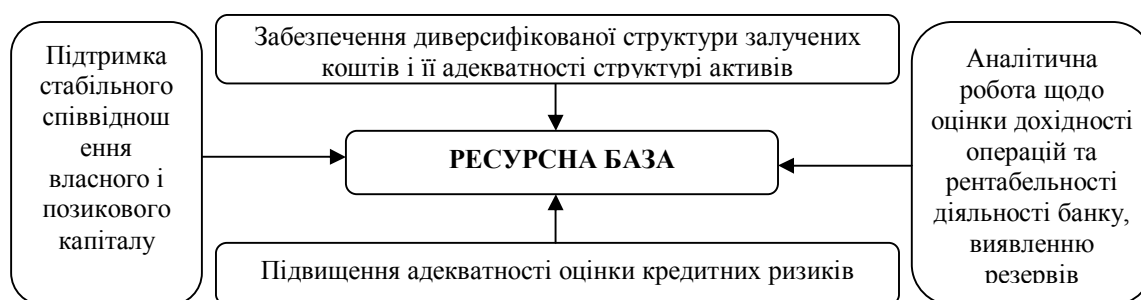
Рис. 1. Формування ресурсної бази банку

Виклад основного матеріалу дослідження. Одним із ключових напрямів управління фінансовою стійкістю банку є створення його ресурсної бази (рис. 1). Основними особливостями структури ресурсної бази вітчизняних банків на цьому етапі розвитку банківської системи можна віднести: низьку частку власного капіталу в активах і термінових депозитів у пасивах, переважання короткострокових пасивів, що обмежує можливості довгострокових вкладень, високу частку залишків по рахунках підприємств і організацій. В умовах економічної нестабільності банк є достатньо ризикованим економічним агентом, який, здійснюючи різні грошові операції, переймає на себе ризики своїх клієнтів, що визначає необхідність створення резервів.