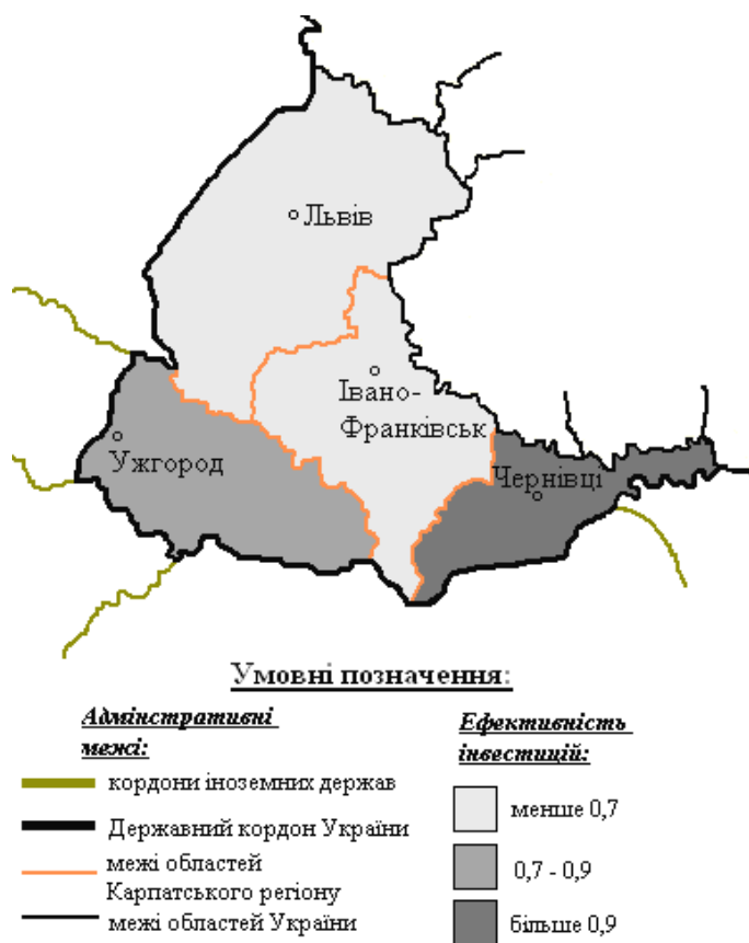
Рис. 2. Геопросторові відмінності ефективності використання інвестицій в основному капіталі областей Карпатського регіону, у середньому за 2005–2011 рр.

Таким чином, судячи з проведеного аналізу, Львівська та Івано-Франківська області Карпатського регіону потребують нових підходів до управління інвестуванням основного капіталу та абсолютно нової інвестиційної стратегії.