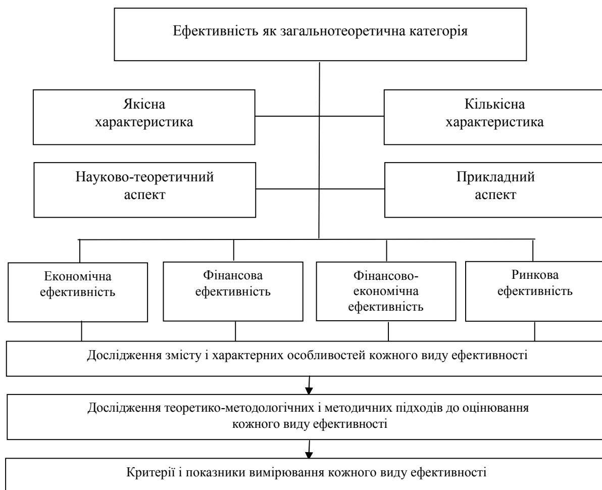
Рис. 2. Концептуальні підходи до системного дослідження ефективності як економічної категорії

На рис. 2 зображено наше концептуальне бачення стосовно дослідження змісту і основних складових (основних елементів, видів) ефективності як економічної категорії.