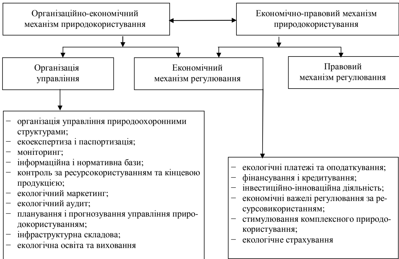
Рис. 1. Структура механізму комплексного природокористування

Основною метою державного регулювання з використання природних ресурсів є вдосконалення застосування системи заходів з екологічного законодавства та економічного стимулювання діяльності конкретних об'єктів. Процес регулювання являє собою реальний механізм включення природозахисної політики у функціонування господарської системи. До таких регуляторів, як правило, відносять: нормативно-правові, організаційно-управлінські та економічні. Всі перелічені важелі можуть діяти як окремо, так і в єдиній системі (рис. 2).