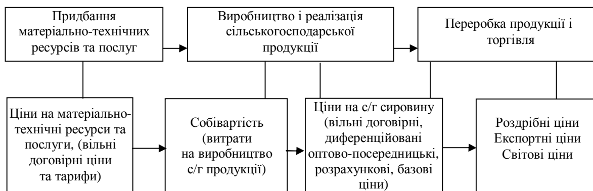
Рис. 1. Структура розподілу цін в галузях АПК

Розподіл цін у галузях агропромислового комплексу охоплює всі стадії процесу відтворення (рис. 1).