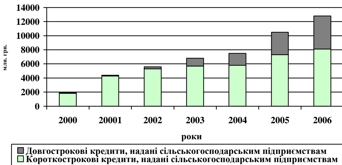
Рис. 1. Обсяги кредитів (в т. ч. коротко- та довгострокових), наданих сільськогосподарським підприємствам України в 2000-2006 рр.

Нині спостерігаються позитивні тенденції кредитування сільськогосподарських підприємств. За даними НБУ, у період з 2000 р. суми залучених банківських кредитів, наданих сільськогосподарським товаровиробникам, зросли більше ніж у шість разів, і на кінець 2006 р. склали 12,8 млрд. грн. (рис. 1). При цьому кількість підприємств, які використовували кредити, зросла на 23% і складала 13,4 тис.