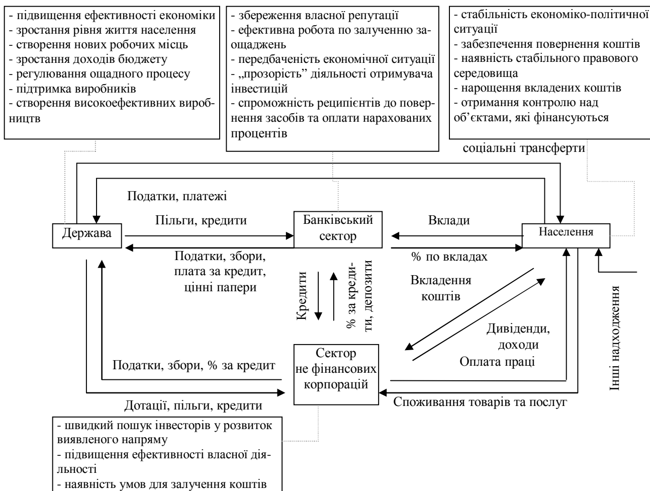
Рис. 2. Цілі й інтереси взаємодії суб'єктів ощадного процесу

Вступаючи в ощадні відносини, кожний із суб'єктів переслідує свої цілі й інтереси. Диференціація останніх достатньо широка – від чисто прагматичної потреби отримати максимальний дохід до завдання підвищення ефективності економіки. Схема взаємодії основних учасників ощадного процесу і узагальнена характеристика переслідуваних ними цілей і інтересів зображена нижче (рис. 2.).